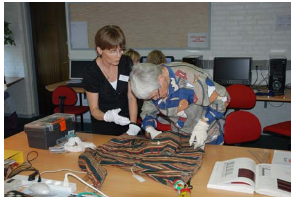
Opmåling af originale dragtdele